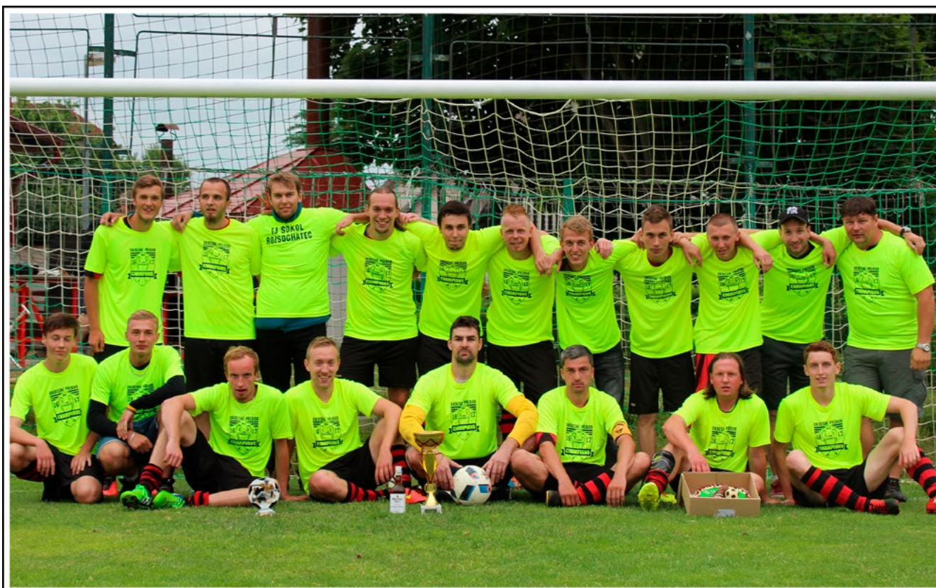
Muži A - Rozsochatec