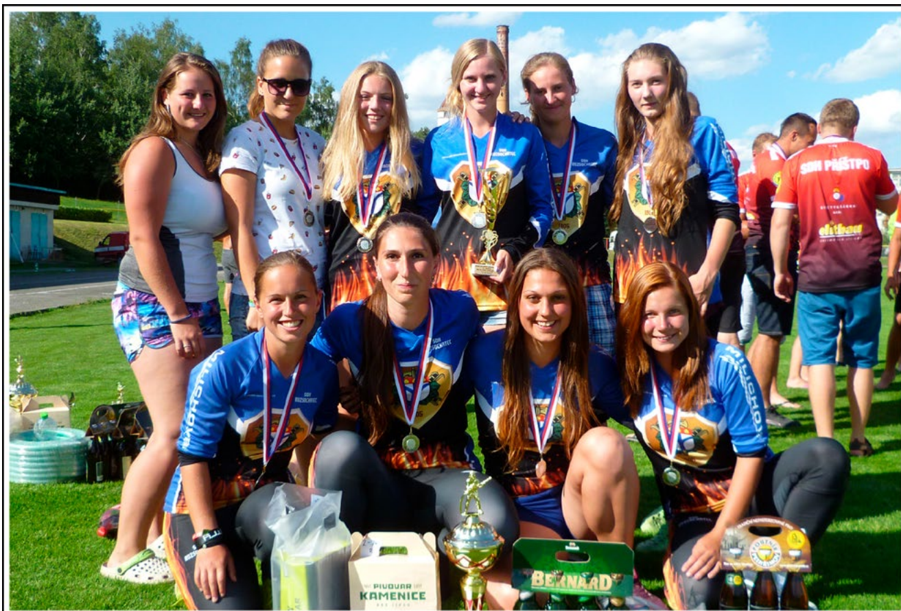
Krajské kolo v požárním sportu