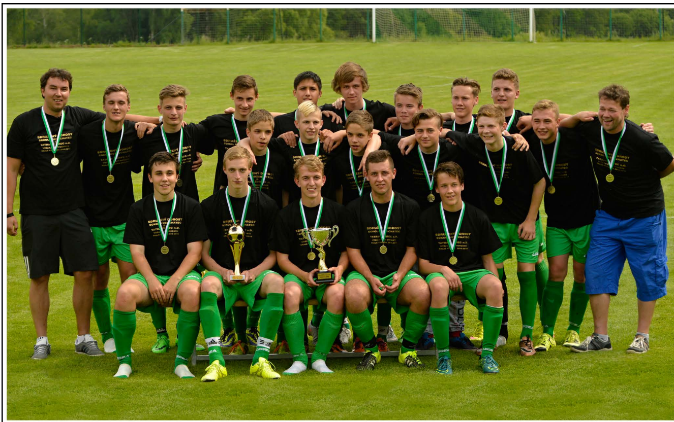
Sdružený dorost Sokol Rozsochatec / Tatraň Ždírec n. D.