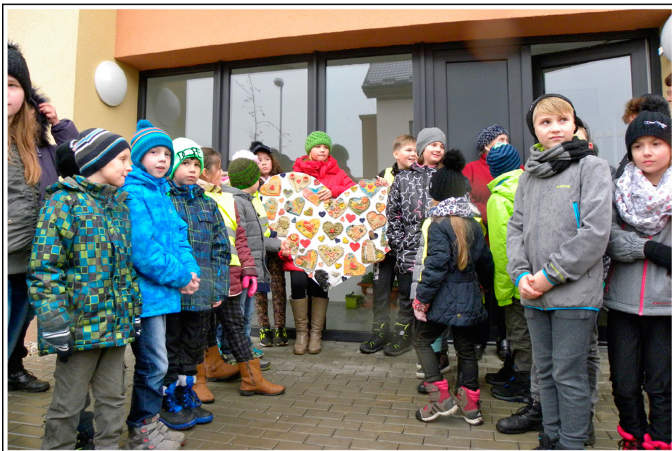
Srdce s láskou darované