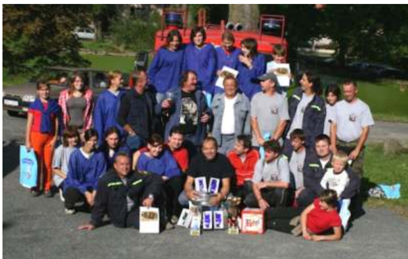
foto ze soutěže v Čachotíně